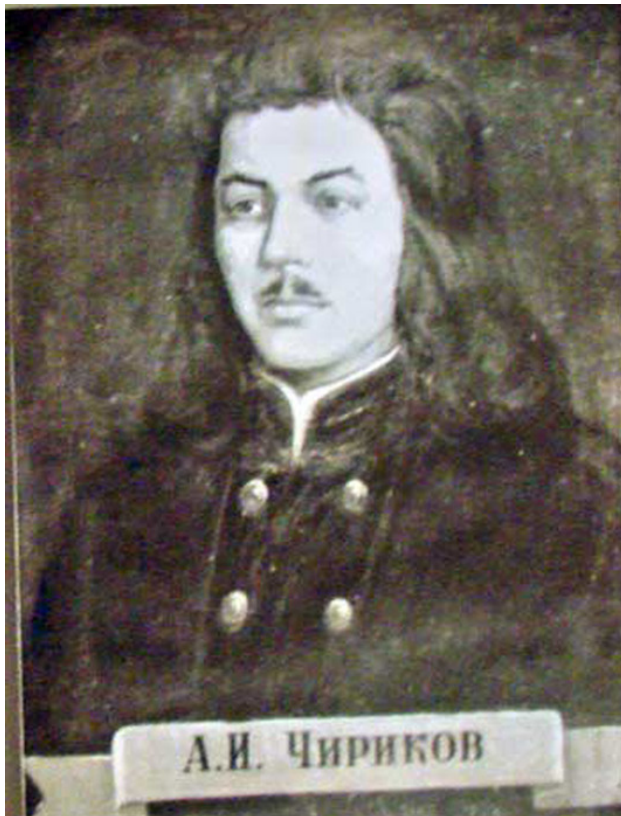
Алексей Ильич Чириков

Воспитанник Морской Академии, лучший ученик ее первого выпуска, в составе которого значились такие известные впоследствии офицеры русского флота, как С. Малыгин, А. Нагаев, Д. Лаптев и другие, Алексей Ильич Чириков при выпуске по распоряжению Петра I, присутствовавшего на экзаменах, был произведен сразу в унтер-лейтенанты (второй офицерский чин тогдашнего флота). После трех лет практического плавания на кораблях Балтийского флота он вернулся обратно в Морскую Академию, но уже в качестве преподавателя - таково было решение Адмиралтейств-коллегий.